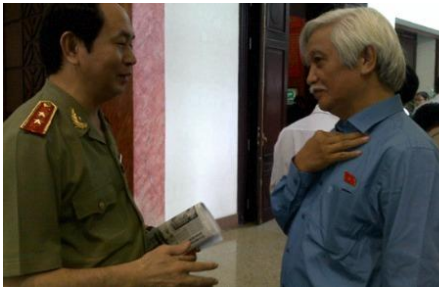
Đại biểu Dương Trung Quốc (phải) trao đổi với Bộ trưởng Bộ Công an Trần Đại Quang bên hành lang kỳ họp Quốc hội thứ hai

Phát hiện một bức ảnh nhiều ý nghĩa trên báo mạng.