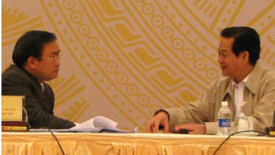
Thủ tướng Nguyễn Tấn Dũng và Phó Thủ tướng Hoàng Trung Hải trao đổi giờ giải lao. i

Ông HTH lại xuất hiện trong Hội nghị về khoáng sản của ASEAN trên VTV 19h.