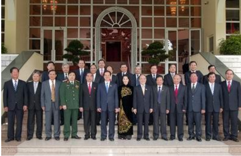
Chính phủ khoá XII đã cơ bản hoàn thành nhiệm vụ

Ngày 24, 25, 26, 27, 28/7/2011. Tôi gửi thư tố cáo qua mạng lần thứ 54, 55, 56, 57 và 58: